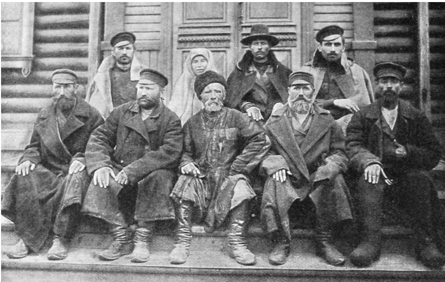
1. Группа ходоков // Азиатская Россия. Люди и порядки за Уралом : в 3 т. / под ред. И. И. Тхоржевского. СПб. : Изд. Переселенч. управления гл. управления землеустройства и земледелия, 1914. Т. 1. С. 474

Переселенческая политика российских властей нашла свое закрепление в различных нормативно-правовых актах, в которых регламентировался и порядок водворения сибирских новоселов. Согласно закону, водворению крестьян-переселенцев должна была предшествовать разведка, осуществлением которой занимались представители крестьян – ходоки (групповые и одиночные), которые выбирали места для поселения доверителей (ил. 1, 2). Желая осесть на новом